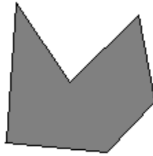
Poligono Semplice Concavo